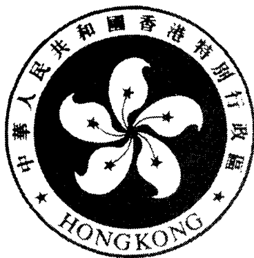
香港特别行政区区徽图案