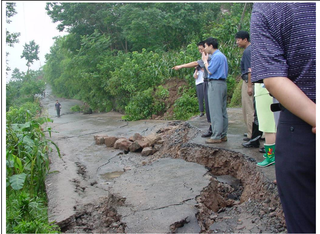
迅速组织人员查看滑坡的分布范围，分析隐患，划定危险边界（重庆云阳，2000）